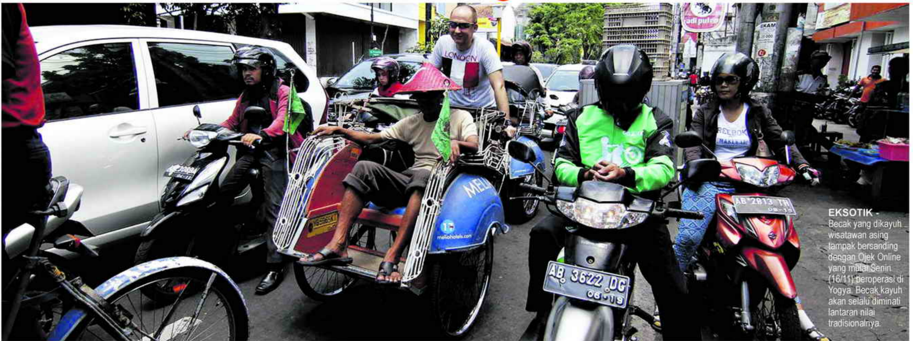
EKSOTIK - Becak yang dikayuh wisatawan asing tampak bersanding dengan Ojek Online yang mulai Senin (16/11) beroperasi di Yogya. Becak kayuh akan selalu diminati lantaran nilai tradisionalnya.